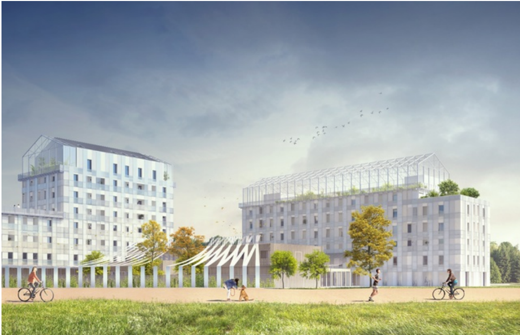
Image de synthèse du projet Les 5 ponts à Nantes. - Cabinet Asylum - Tetrarc

( http://www.20minutes.fr/nantes/1949291-20161025-nantes-bains-douches-vont-rejoindre-restaurant-social-ile-nantes ) à l'ouest de l'île de Nantes.