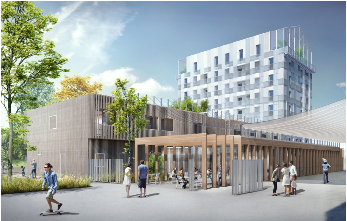
Image de synthèse du projet Les 5 ponts à Nantes. — Cabinet Asylum - Tetrarc

Frédéric Brenon | 🕒 Publié le 02/11/17 à 18h01 — Mis à jour le 03/11/17 à 07h28